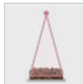
Disparo vertical sem cortina

* A imagem do produto pode variar de acordo com as adaptações do equipamento.