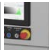
Parada de emergência